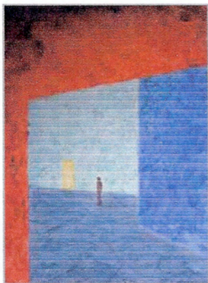
Parcours dans l'espace végétal V

Après trois ans de succès, « Sonvillaz, à la rencontre de l'artiste » invite le visiteur à un nouveau rendez-vous avec un créateur de renom. Par René Carmen